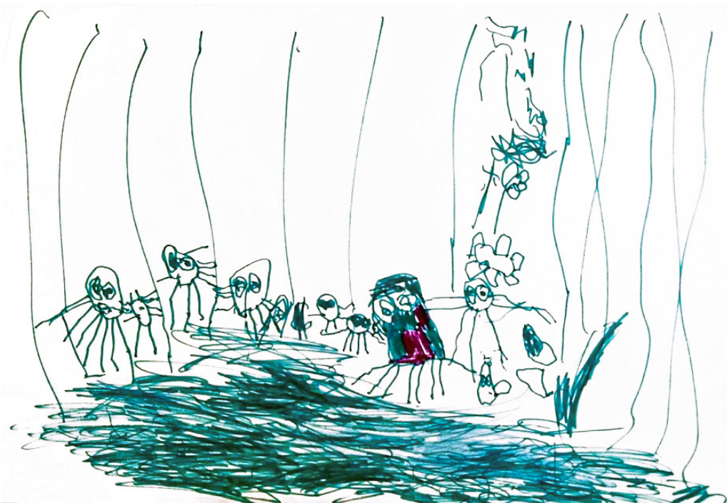
con sus amigos , papás y mamás.