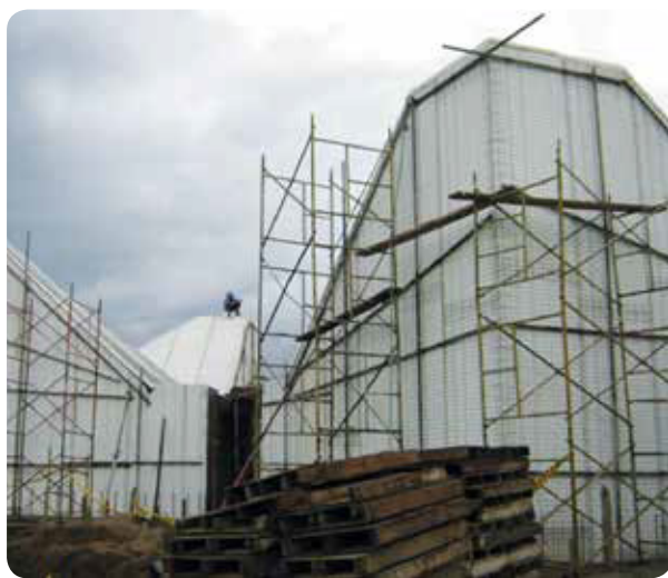
•• Construcción del Centro aeioTU La Paz, Santa Marta

A continuación se presenta el ejemplo de la construcción adelantada para el Centro La Paz, ejecutado con el sistema de “Durapanel”, en el cual los costos de ejecución fueron significativamente altos por metro cuadrado