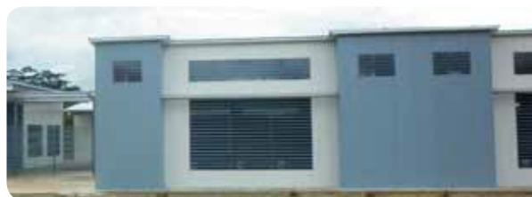
•• Construcción del Centro aeioTU Cabí, Quibdó

Cobra gran importancia el tiempo de construcción, ya que éste también influye en los costos totales de la obra. Gracias al uso del material Azembla un Centro aeioTU puede ser construido en tres meses, como sucedió con nuestro Centro aeioTU Cabí, en Quibdó, mientras que la construcción de un Centro como aeioTU La Paz (fotos anteriores) tardó once meses.