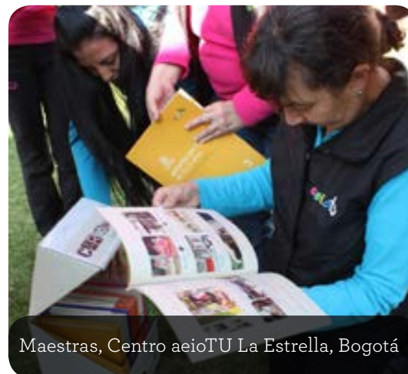
Maestras, Centro aeioTU La Estrella, Bogotá

Los coordinadores generales de los centros aeioTU se reunieron durante una semana en Cajicá, y recibieron una copia de la Cartografía Curricular. Este conjunto de instrumentos pedagógicos fue creado por el equipo de aeioTU desde su práctica, con el fin de ayudar a los educadores a implementar la Experiencia Educativa aeioTU con calidad, claridad y coherencia. La Cartografía, que se venía trabajando desde unos años atrás, tuvo su revisión final en el 2015 y se produjo su primera edición a principios del 2016. Durante el encuentro los coordinadores tuvieron la oportunidad de analizar en profundidad la Cartografía, aclarar dudas y establecer estrategias para darla a conocer a sus equipos.