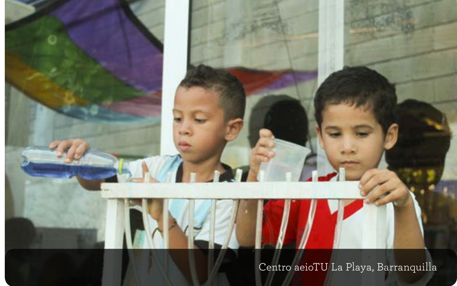
Centro aeioTU La Playa, Barranquilla