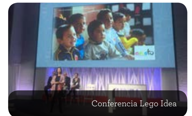
Conferencia Lego Idea