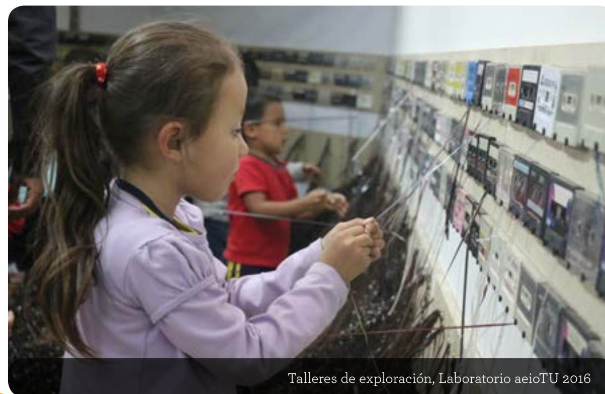
Talleres de exploración, Laboratorio aeioTU 2016

El Museo de Arte Moderno de Bogotá, MAMBO, abrió sus puertas al Laboratorio aeioTU Tejemos Comunidades. Esta iniciativa incluyó una muestra representativa de la exhibición que hace visible la forma en que los niños de los centros aeioTU construyen su conocimiento, talleres de exploración para niños y adultos, una jornada pedagógica sobre arte y pedagogía; y el evento MAMBO al parque, que se realizó en la mañana del pasado sábado. El evento recibió a cientos de niños, educadores y padres de familia provenientes de diferentes comunidades en Bogotá. Los educadores y artistas de nuestro equipo realizaron un gran trabajo colaborativo para asegurar su adecuado desarrollo y que los asistentes se llevaran un memorable recuerdo de su participación.