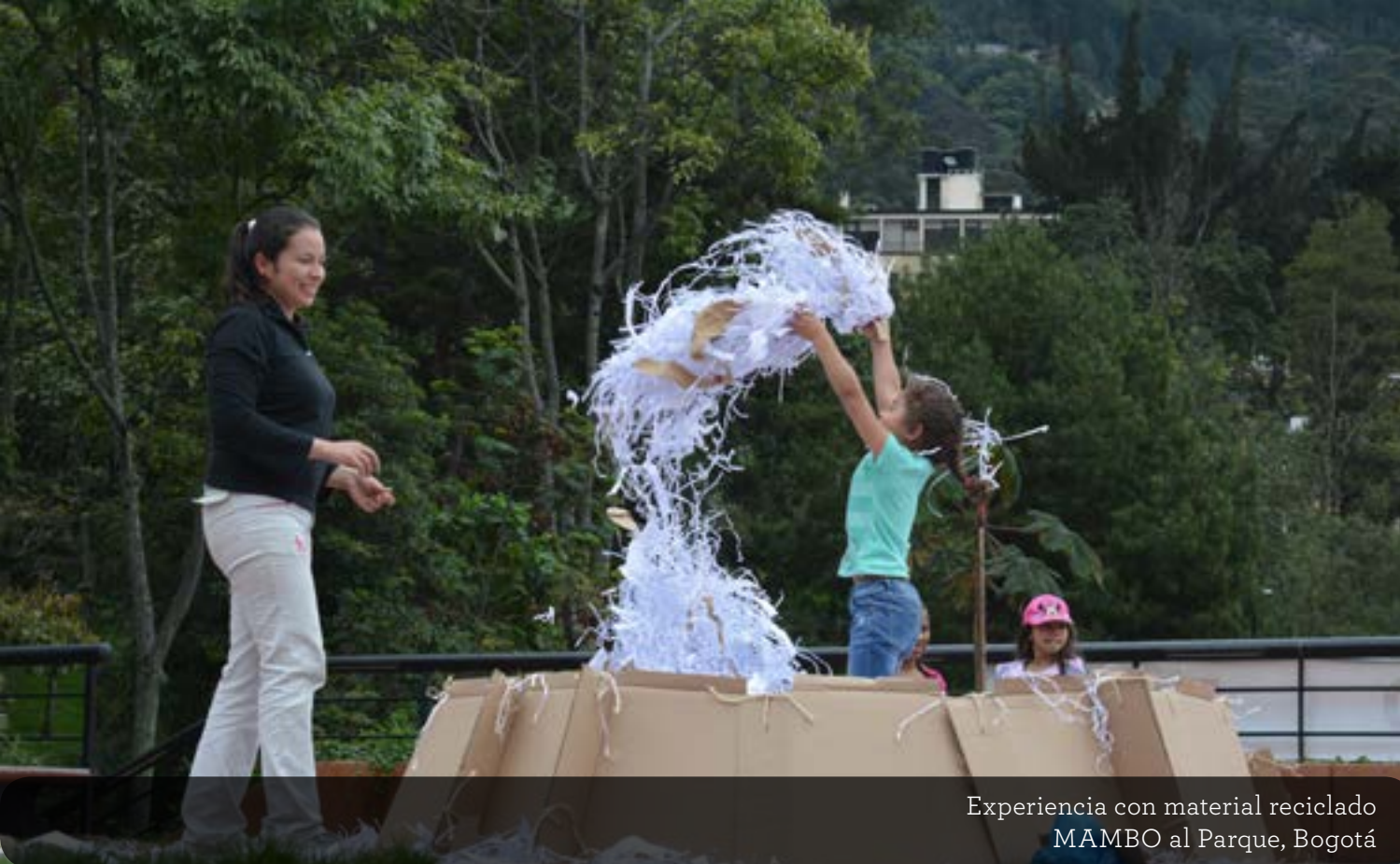
Experiencia con material reciclado MAMBO al Parque, Bogotá