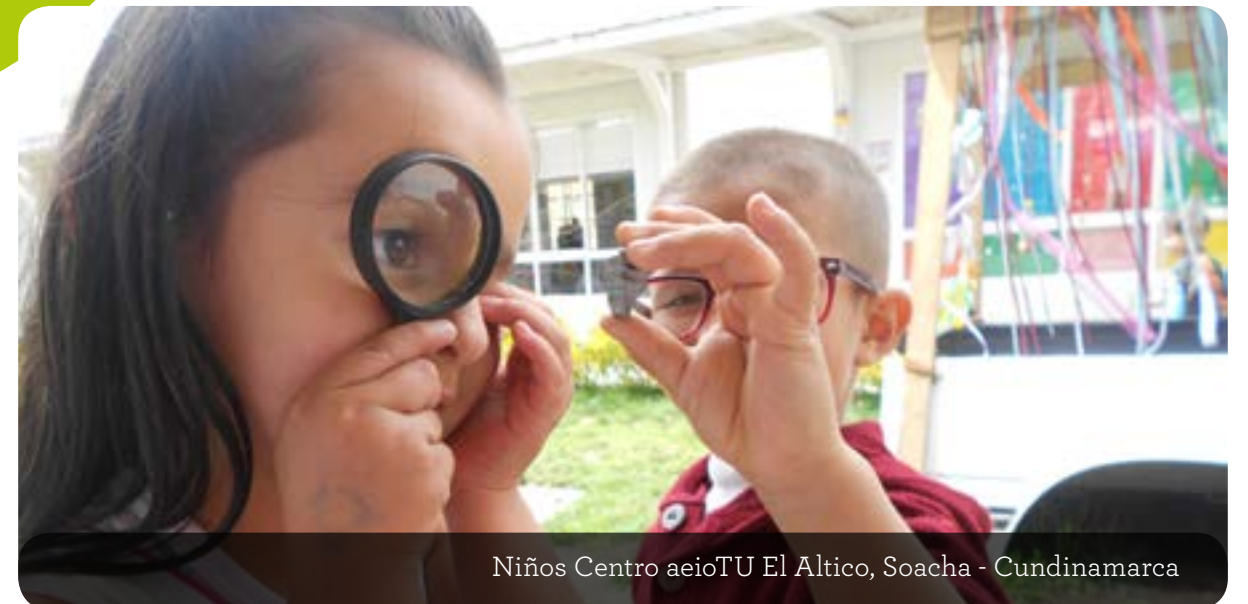
Niños Centro aeioTU El Altico, Soacha - Cundinamarca

Ladrillera Santafé se unió al propósito de aeioTU de transformar comunidades de manera sostenible por medio del desarrollo del potencial de la primera infancia, aliándose con nuestra organización para apoyar la operación del centro aeioTU El Altico, ubicado en Soacha, muy cerca de Altos de la Florida, comunidad en donde la ladrillera tiene su planta e instalaciones. La inversión social que realizó la ladrillera consistió en 45 millones de pesos, y beneficia directamente a la comunidad cercana a la organización.