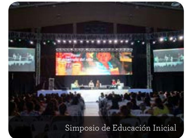
Simposio de Educación Inicial

En el auditorio de la Universidad del Norte, en Barranquilla, se llevó a cabo el Simposio de Educación Inicial organizado por aeioTU al cual asistieron más de 2.100 educadores provenientes de 7 departamentos de la Costa Caribe de nuestro país. Allí, agentes educativos de 600 Unidades de Servicio asistieron para escuchar intervenciones sobre la educación con calidad en primera infancia; y para compartir con sus compañeros aquellas experiencias significativas que han llevado a cabo en su comunidad educativa para fortalecer la educación inicial.