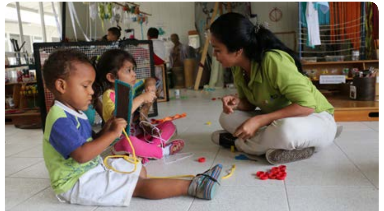
Experiencias, Centro aeioTU Bureche, Santa Marta

De la misma forma, contamos con un Programa de