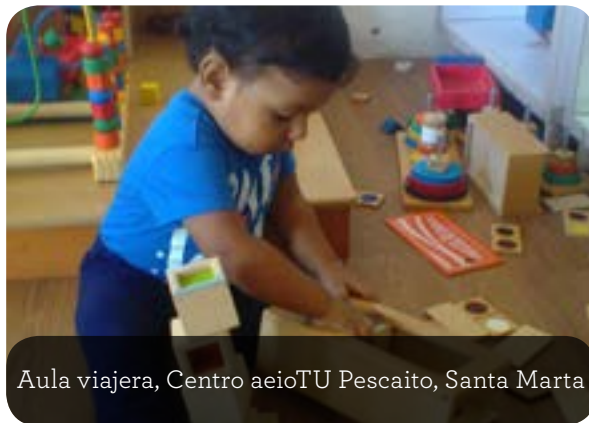
Aula viajera, Centro aeioTU Pescaito, Santa Marta

Gracias a la firma de un convenio con el Banco Interamericano de Desarrollo - BID-, aeioTU y la iniciativa Tras La Perla de La América lograron gestionar el apoyo de esa institución para la comunidad de Pescaito, en Santa Marta. El apoyo, representado en un millón de dólares, se destinará para promover el desarrollo de la primera infancia, la inclusión social y la sostenibilidad urbana de la comunidad. En el territorio aeioTU opera actualmente el centro aeioTU Pescaito, que consiste en un aula viajera que sirve como punto de reunión a las 350 familias cuyos niños hacen parte del programa aeioTU en casa. Los invitados especiales del evento visitaron esta aula viajera durante su estadía en la ciudad.