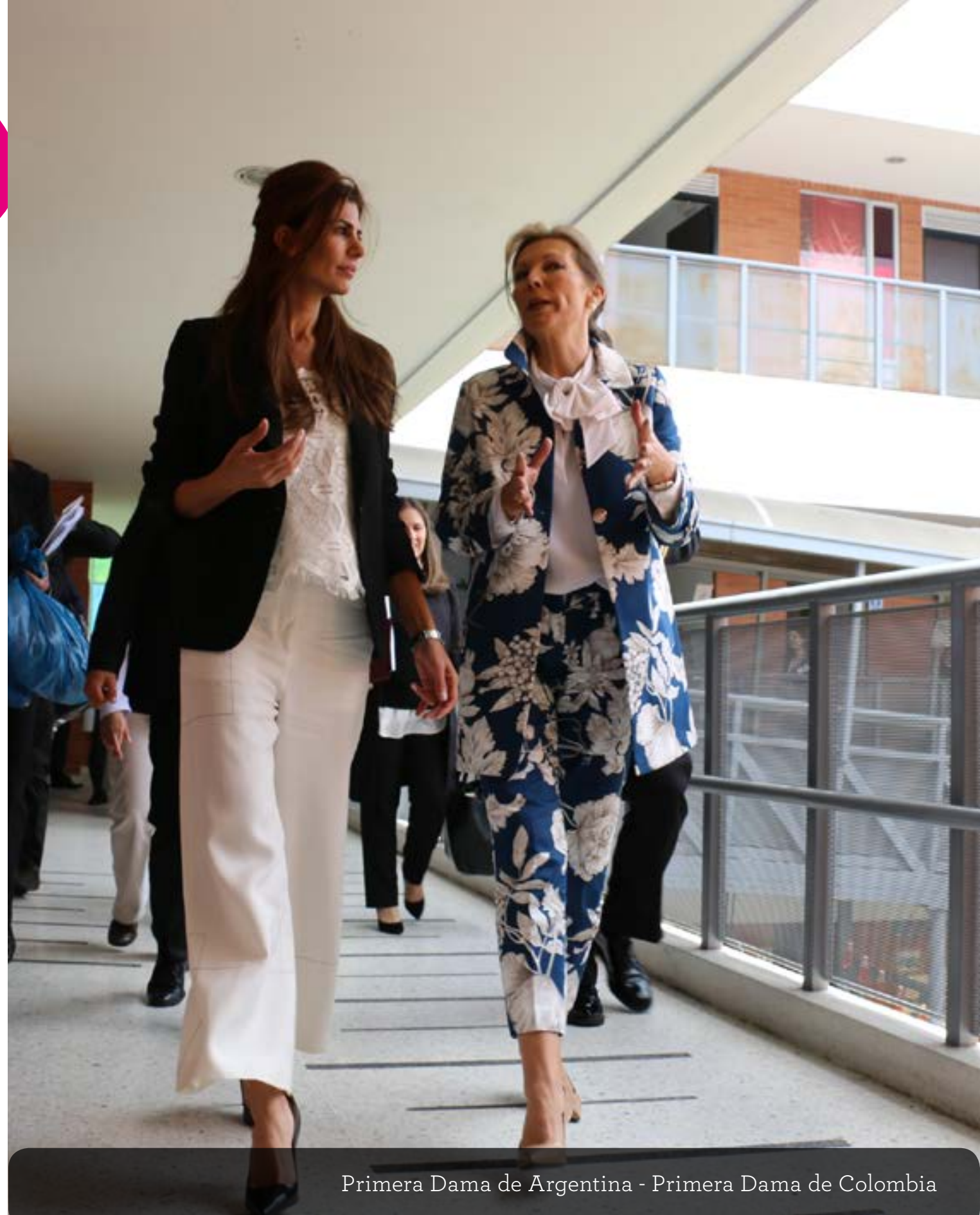
Primera Dama de Argentina - Primera Dama de Colombia

La Primera Dama de nuestra nación, María Clemencia Rodríguez de Santos, visitó el centro aeioTU Olaya Herrera en compañía de la Primera Dama de Argentina, Juliana Awada. Con esta visita, en la cual las esposas de los mandatarios de las dos naciones recorrieron el centro, reconocieron el modelo educativo de aeioTU e incluso compartieron tiempo con los niños en sus aulas; se confirma la importancia que los dos países dan a la inversión en la primera infancia. aeioTU Olaya Herrera es un centro educativo que se hizo realidad gracias a los aportes de aliados como Funtalentum, el ICBF y la Fundación Bancolombia.