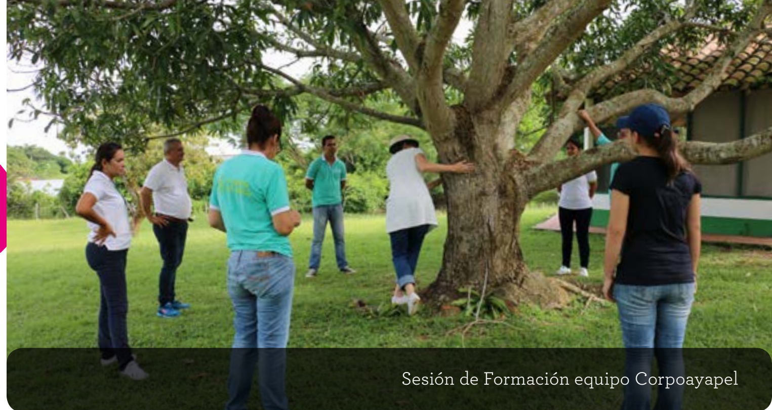
Sesión de Formación equipo Corpoayapel

El acompañamiento constó de 5 fases, incluyendo la realización de un diagnóstico inicial, que sirvió como línea base para la segunda fase, que consistió en el alistamiento del plan de trabajo. Luego se realizó la fase de formación, que se llevó a cabo durante 4 semanas presenciales en las que estuvo presente el equipo de líderes de CorpoAyapel y el equipo formador de aeioTU. Durante las 3 primeras semanas se compartieron con ellos contenidos teóricos sobre el marco conceptual, la gestión y operación de centros educativos para la primera infancia; y la Experiencia Educativa aeioTU. La última semana consistió en la implementación de los conocimientos adquiridos en la práctica, jornada que se llevó a cabo en el centro aeioTU Moravia, ubicado en Medellín. Este centro, que es un Centro de Desarrollo Profesional en aeioTU, ofreció al equipo de CorpoAyapel la oportunidad de observar las prácticas pedagógicas de los maestros de aeioTU, dialogar con ellos, resolver inquietudes, y experimentar, desde la práctica cotidiana, de qué manera