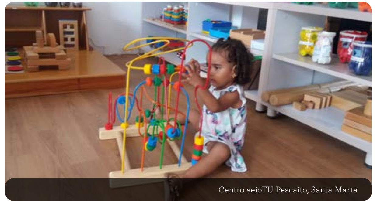
Centro aeioTU Pescaito, Santa Marta

Este centro es una realidad gracias al esfuerzo conjunto de la Alcaldía Santa Marta, el BID, Carlos Vives con Tras la Perla de la América, el ICBF, la Fundación Éxito y aeioTU. Se creó