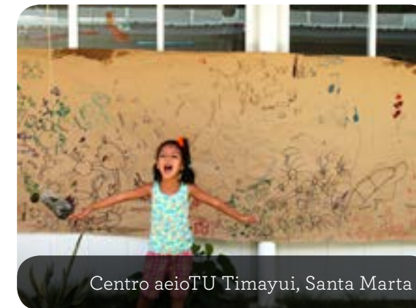
Centro aeioTU Timayui, Santa Marta

Este proceso de formación se realizó con 54 maestras en las ciudades de Ibagué, Popayán y Valledupar y a 32 profesionales de la salud de la ciudad de Montería, y tuvo como escenario los entornos educativos y de salud en los