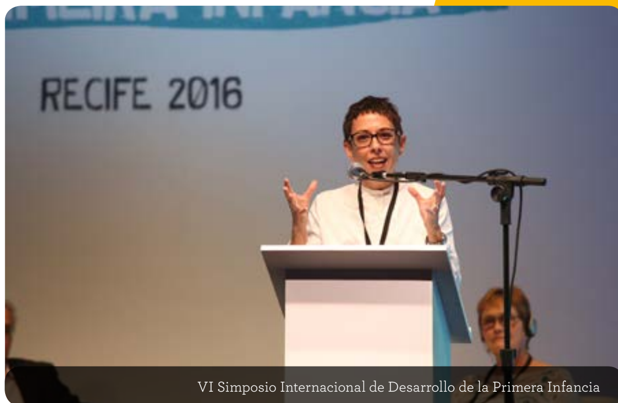
VI Simposio Internacional de Desarrollo de la Primera Infancia