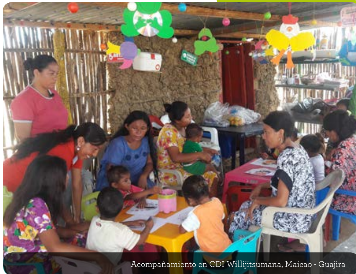
Acompañamiento en CDI Willijitsumana, Maicao - Guajira

Dentro del marco de la Estrategia de Atención Integral a la Primera Infancia “De Cero A Siempre” la Comisión Intersectorial Para la Primera Infancia (CIPI) lanzó, durante el 2016, el proceso de fortalecimiento de la calidad en la educación inicial.